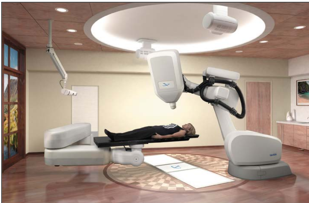
放射線治療機器 「サイバーナイフ ラジオサージェリーシステム」(第4世代)